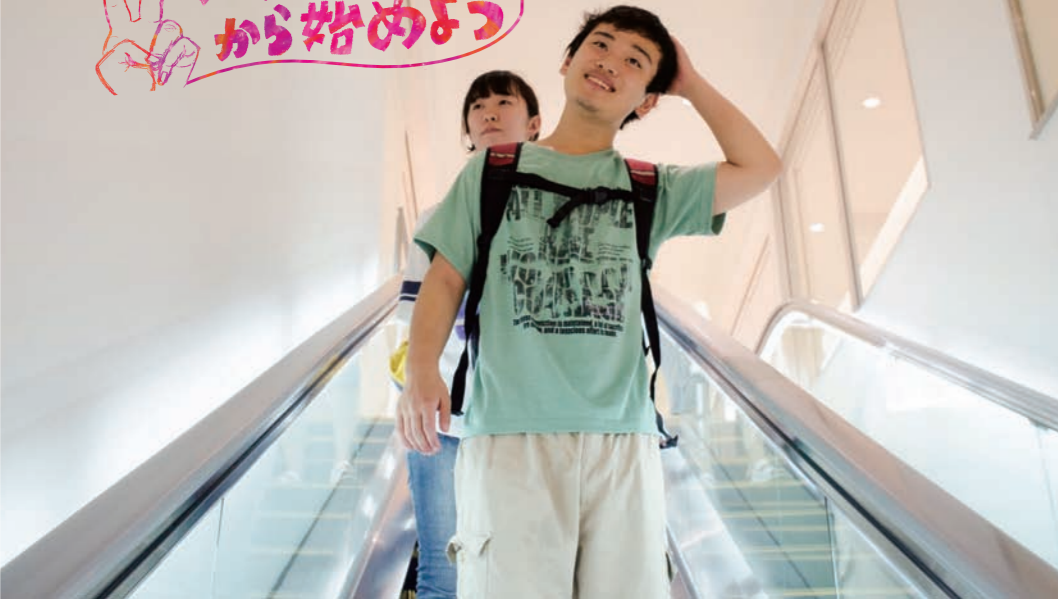
障害者が外出するためのパートナーであるガイドヘルパー。