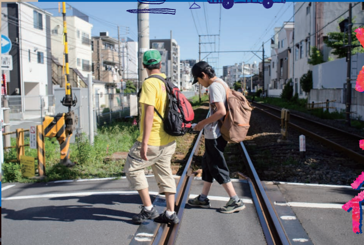
この街はヘルパーが不足していて外出できない人がたくさんいます。*